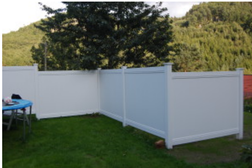
NG-15N. Høy levegg