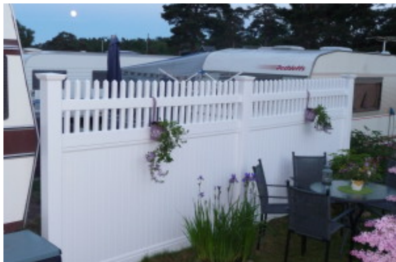
NG-16N. Høy levegg med stakitt-topp