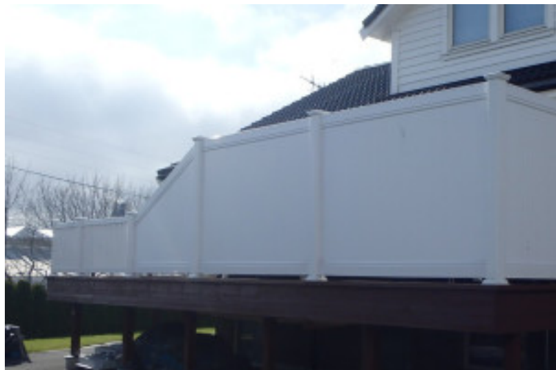
NG-15D. Skrå levegg