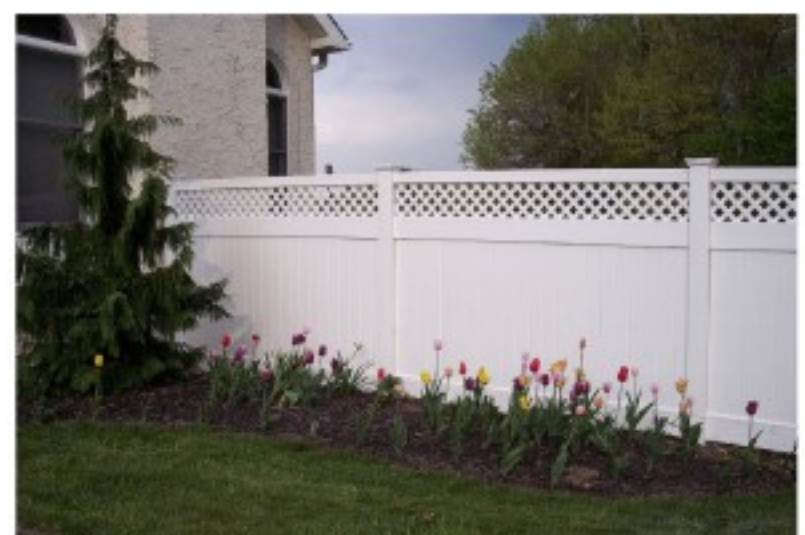
NG-17N. Høy levegg med espalier

Alle priser er oppgitt inkl. mva. Fraktkostnader, ekspedisjons/fakturagebyr og emballasje/pallekostnad tilkommer. Vi tar forbehold om prisendringer grunnet innkjøpspris-, frakt- eller valutaendringer. Vi tar ikke ansvar for feilmålinger i bestillinger oppgitt av kunde.